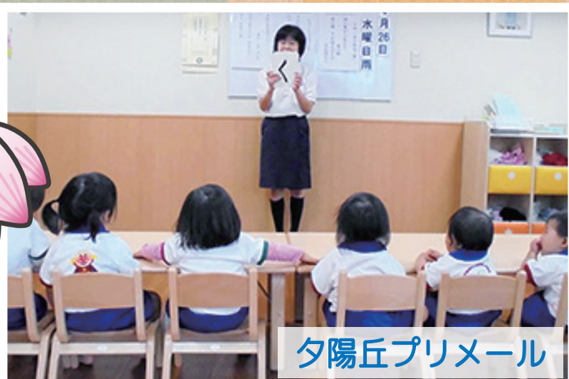
夕陽丘プリメール