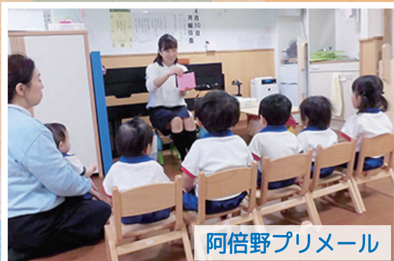
阿倍野プリメール